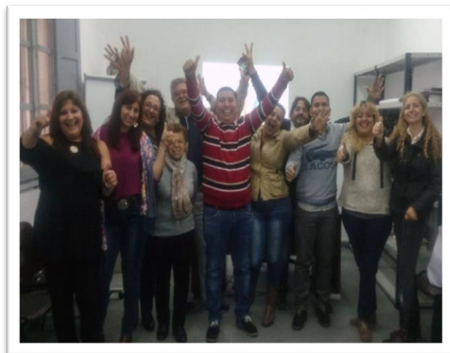
imagen personal, hasta llegar a un plan de acción individual, el cual fue expuesto por cada uno de los integrantes del grupo.

A lo largo de 20 horas, los profesores Ana Climent y Gonzalo Acosta fueron formando a los alumnos con dinámicas grupales donde se trabajó la autoestima, la comunicación, el liderazgo y la